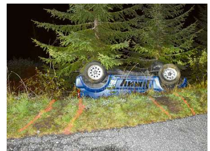
Igl auto ei cupitgaus sur la via ora.